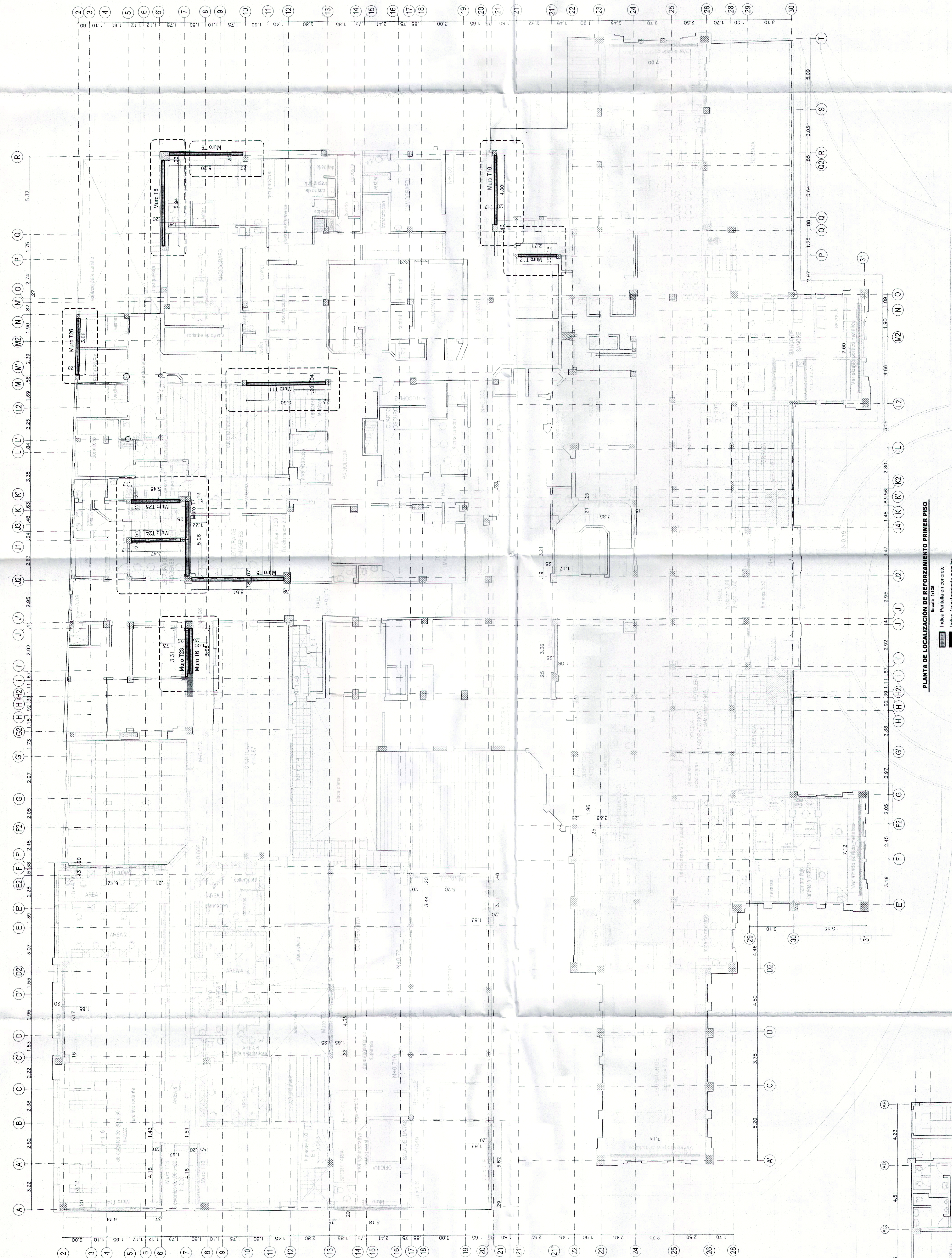
PLANTA DE LOCALIZACIÓN DE REFORZAMIENTO PRIMER PISO Escala: 1:125 Índice Pantallas en concreto Índice Anclajeamiento muello

14 JUN 2022 Código 1001-5-22-0078 Código 1001-5-22-0204 NO. DE ACTO ADMINISTRATIVO: 1001-5-22-8408 04 NOV 2022 Corporación Urbana Bogotá D.C.